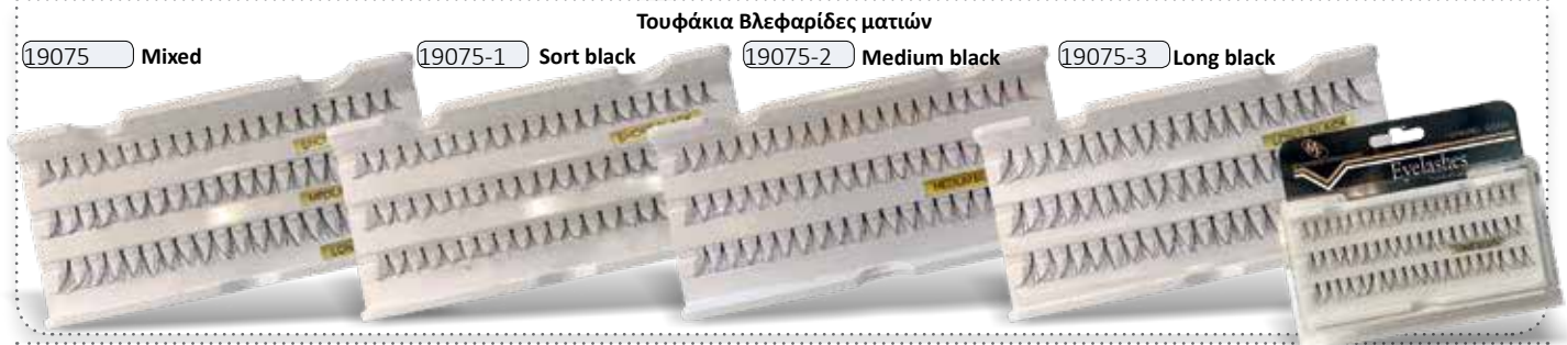
Τουφάκια Βλεφαρίδες ματιών