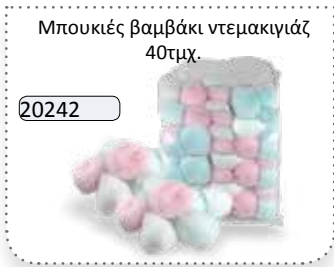
Μπουκιές βαμβάκι ντεμακιγιάζ 40τμχ.