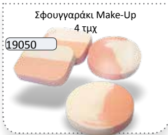
Σφουγγαράκι Make-Up 4 τμχ