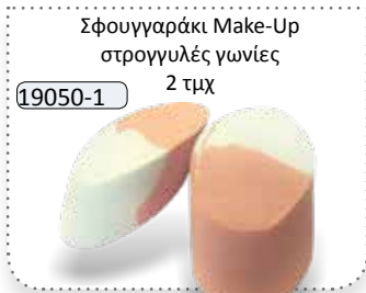
Σφουγγαράκι Make-Up στρογγυλές γωνίες 2 τμχ