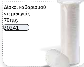
Δίσκοι καθαρισμού ντεμακιγιάζ 70τμχ.