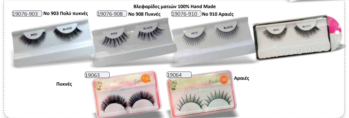
Βλεφαρίδες ματιών 100% Hand Made